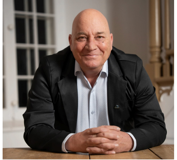
Sylvain Ouimet, maire

Par ailleurs, le 12 avril à 9 h, au Vieux Presbytère de Deschambault, je vous invite à un déjeuner du maire. Des conseillers municipaux se joindront également à moi. Ce sera une belle occasion d'échanger simplement avec vous et de prendre le pouls de vos préoccupations et vos idées.